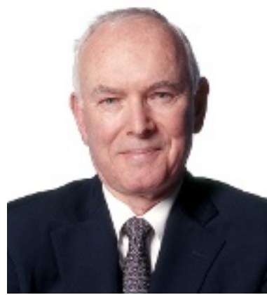
Robert Hogan, presidente de Hogan Assessment Systems.

La alternativa es no desarrollar, quedarse igual para siempre. Todos pueden mejorar su desempeño, pero esa mejora depende de la retroalimentación. Una buena retroalimentación depende de una evaluación competente.